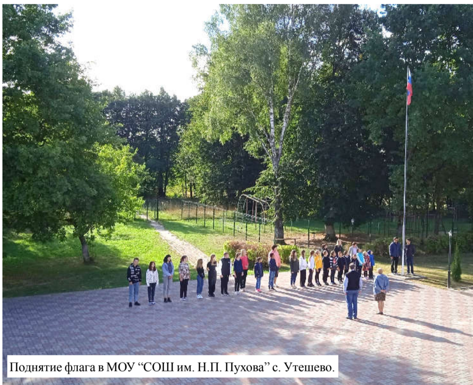
Поднятие флага в МОУ «СОШ им. Н.П. Пухова» с. Утешево.

Новый учебный год в российских школах начался строго регламентировано. Каждый понедельник первым делом перед основными занятиями в образовательных учреждениях поднимают флаг и слушают гимн России, подпевая. Но даже это не последнее, что добавили в школьную программу.