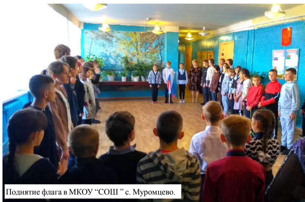
Поднятие флага в МКОУ «СОШ» с. Муромцево.