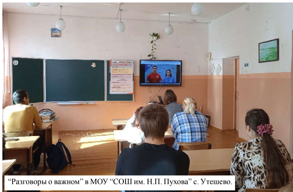
«Разговоры о важном» в МОУ «СОШ им. Н.П. Пухова» с. Утешево.

Важно отметить, что внеклассные часы должны проводиться в виде эвристической беседы, то есть в вопросно-ответном формате, подталкивая учащихся на разговор. Таким образом, «Разговоры о важном» – это не просто монолог классного руководителя, а в каком-то роде дискуссия педагога и детей, построенная вокруг определенных тем.